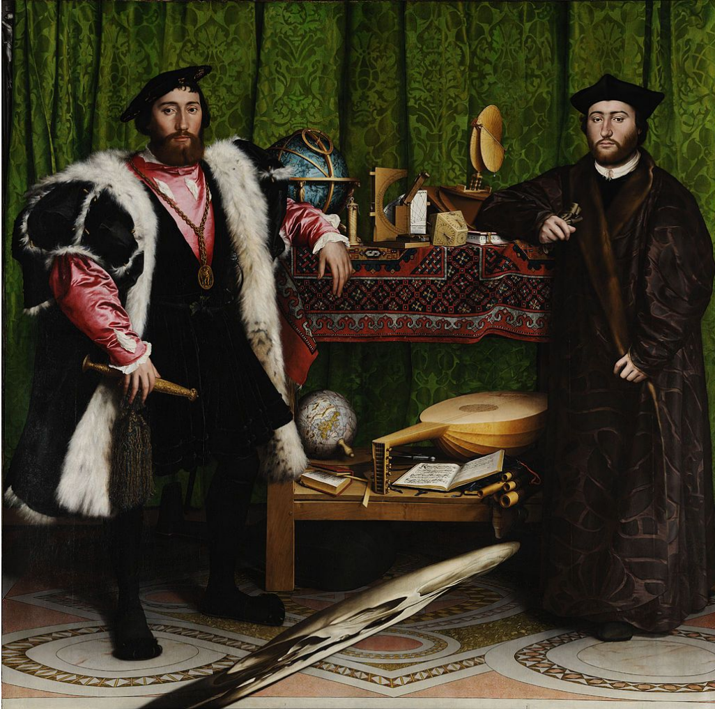
Hans Holbein, The Ambassadors , 1533. हंस Holbein, द राजदूत, 1533।

You are allowed to use phone or computer-based translation for this assignment. If you do, please send the results to: ddrapak@gnspe.ca .