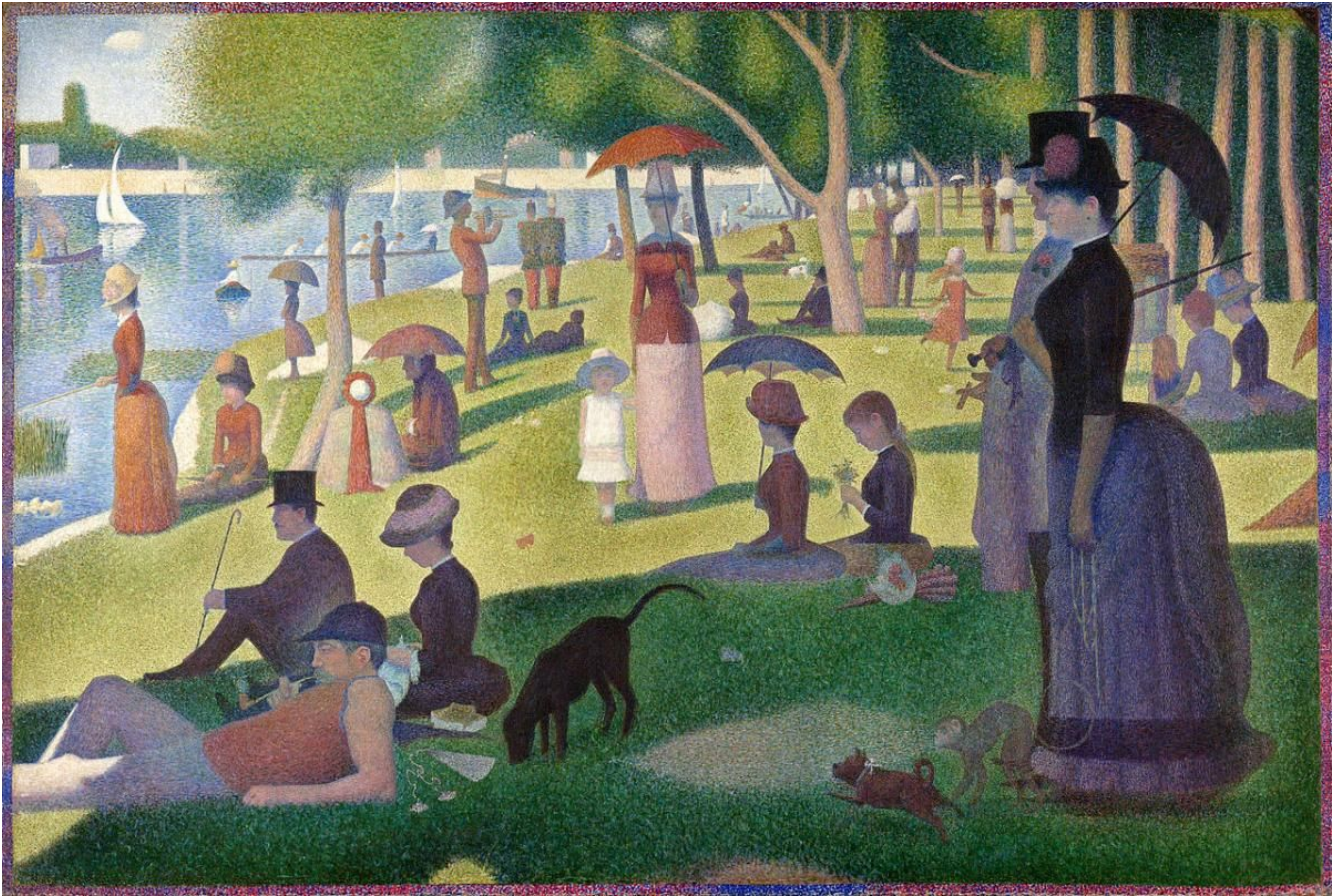
Georges-Pierre Seurat, A Sunday Afternoon on the Island of La Grande Jatte , 1884-1886

Georges-पियरे Seurat, ला Jatte टापु मा एक आइतबार दिउँसो , 1884-1886